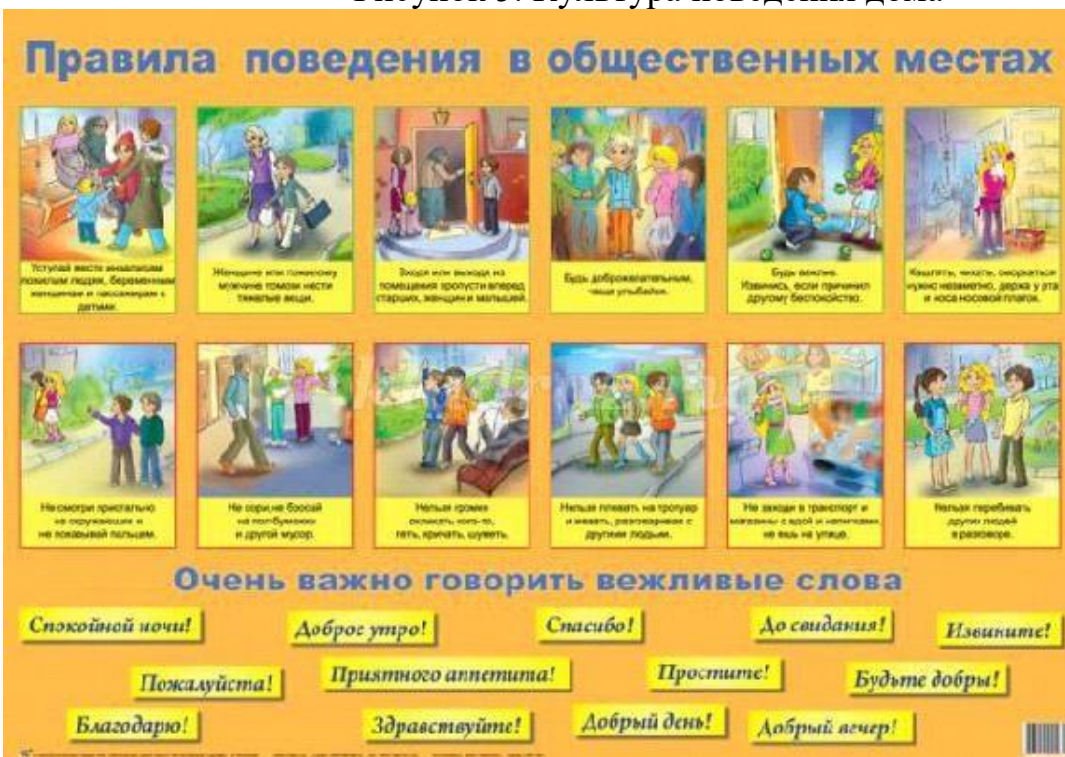
Рисунок 6. Правила поведения в общественных местах