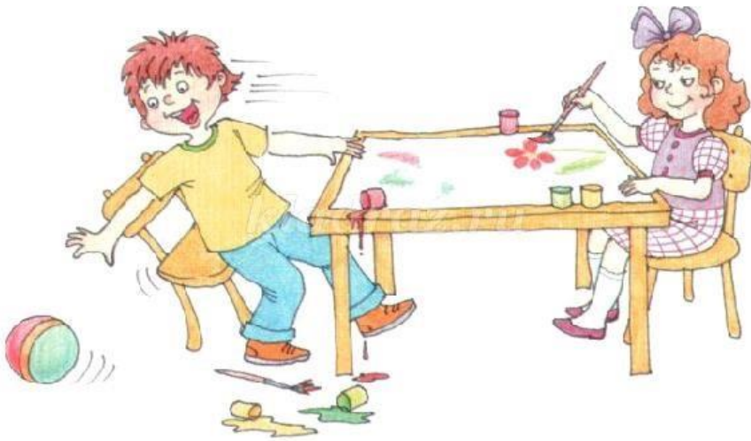
Рисунок 9. Ситуация поведения №3