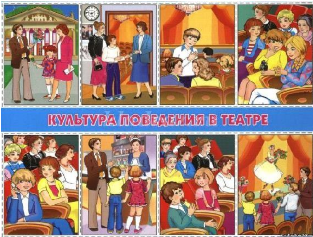
Рисунок 3. Культура поведения в театре