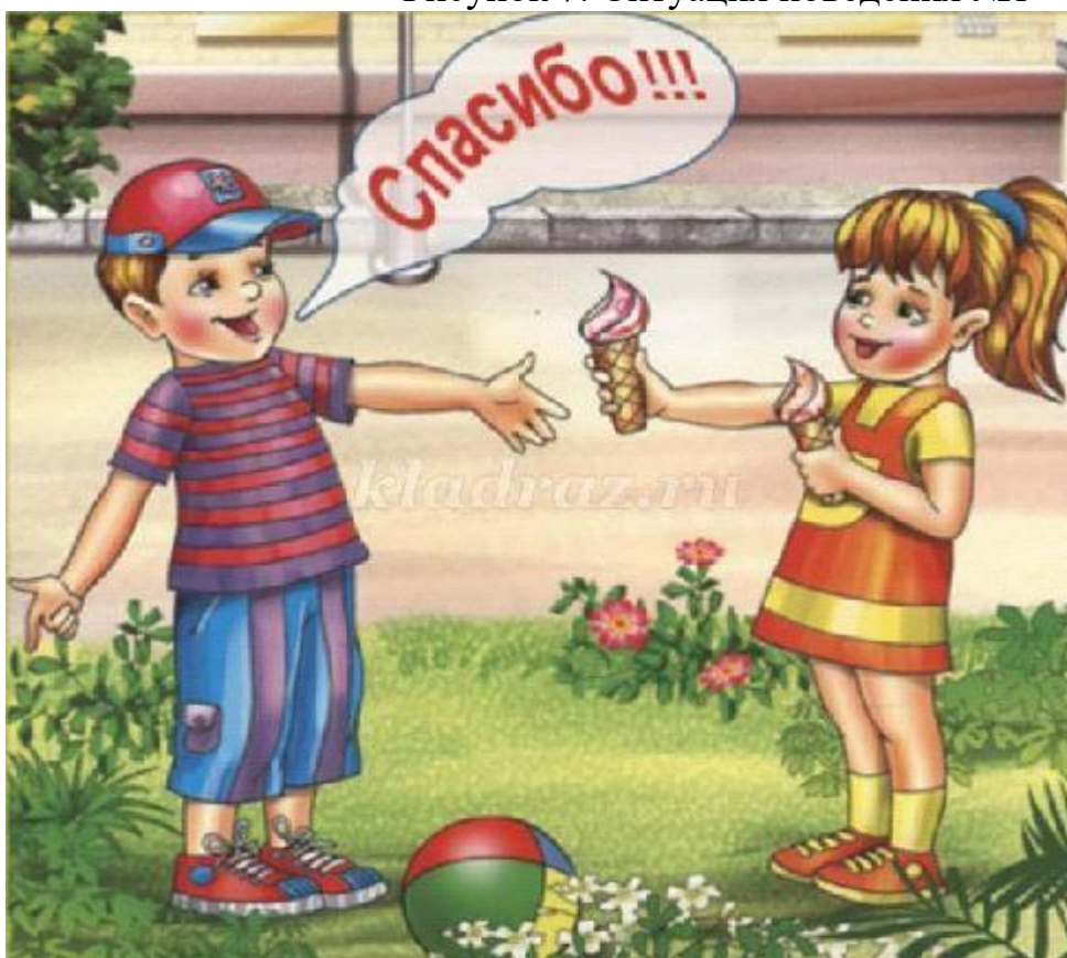
Рисунок 8. Ситуация поведения №2