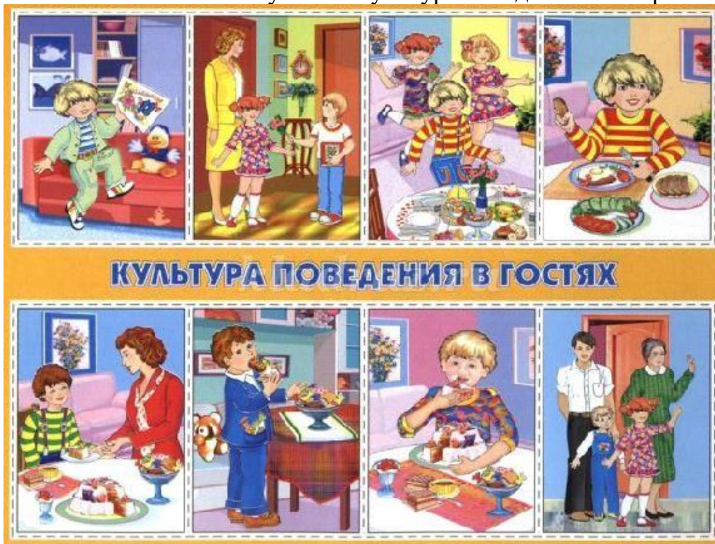
Рисунок 4. Культура поведения в гостях