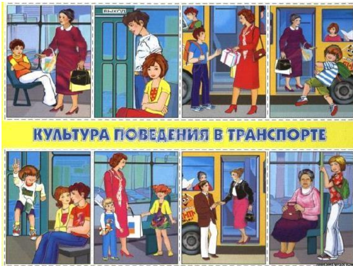
Рисунок 1. Культура поведения в транспорте