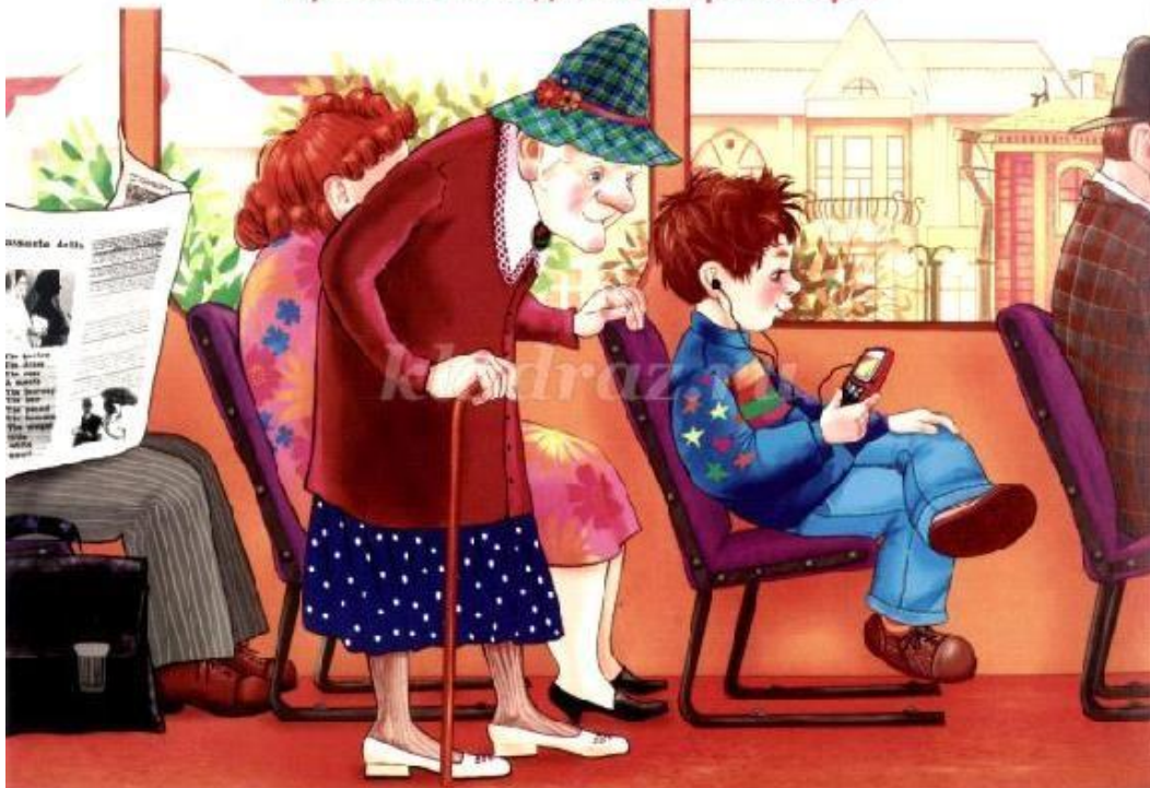
Рисунок 7. Ситуация поведения №1