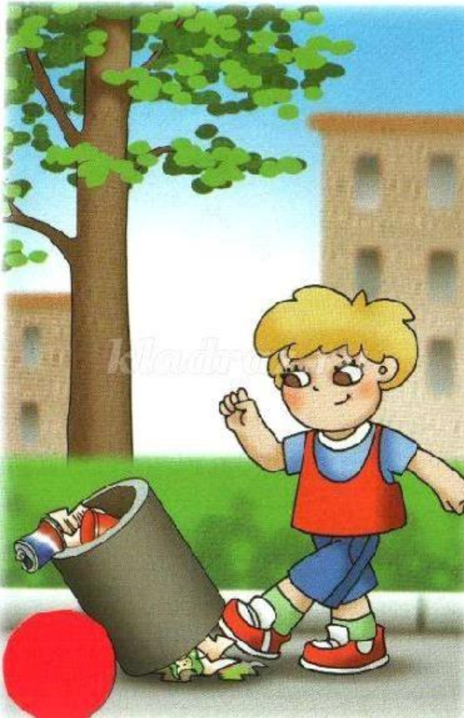
Рисунок 10. Ситуация поведения №4