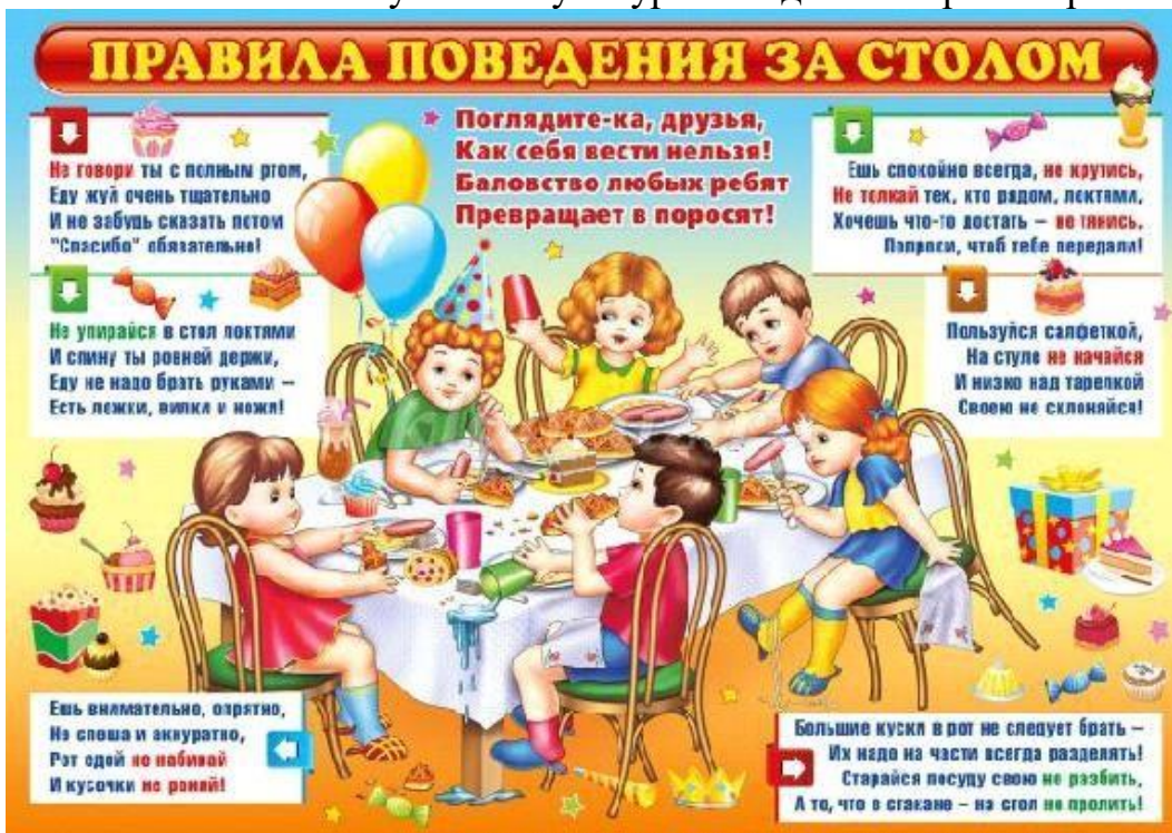
Рисунок 2. Правила поведения за столом